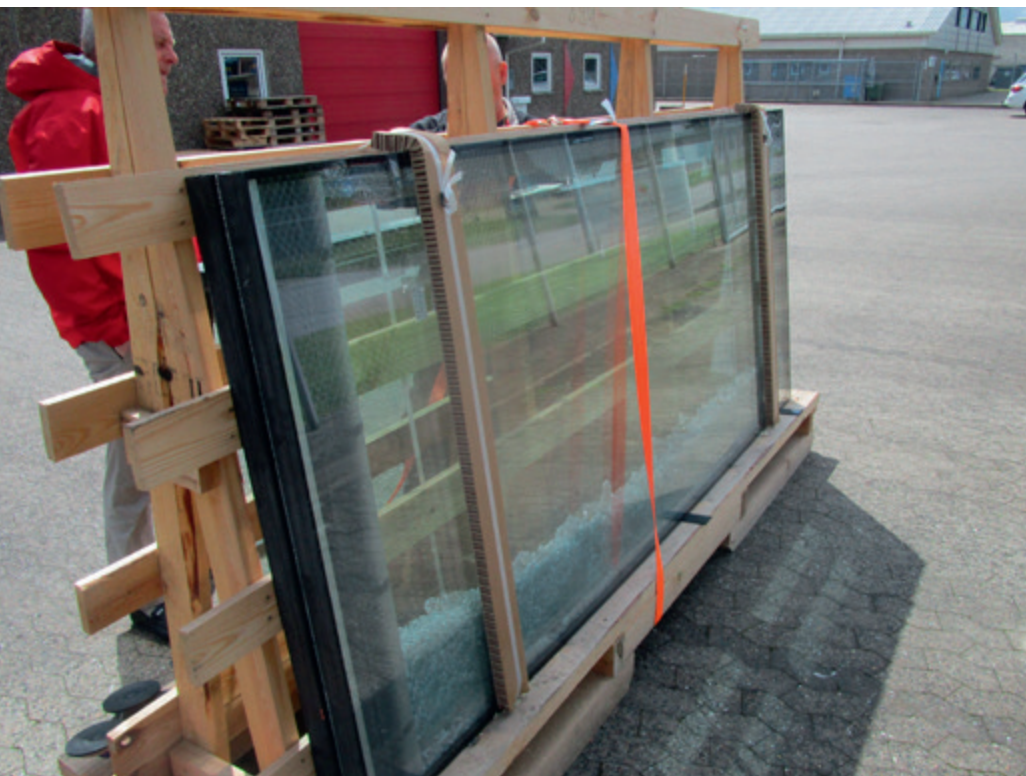
Ruderne på en byggeplads bør dækkes af med en farvet presenning, der sikrer, at solens stråler ikke rammer glasset.

Termisk brud opstår, når temperaturforskellen i et stykke glas bliver for stor. Det kan for eksempel ske, når noget af glasset bliver opvarmet af solens stråler, mens resten af glasset er i skygge. Slagskygger kan blandt andet komme fra udhæng, altaner og markiser. Termisk brud kan også opstå, når der er ophængt rullegardiner, nedsænkede lofter eller andet, der gør, at ruderne ikke kan komme af med varmen på indersiden. Termisk brud ses også, hvis brændeovne, varmeapparater eller lignende bliver placeret for tæt på ruderne.